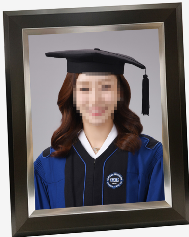
11R 학사복 나무액자(11 X 14 inch)