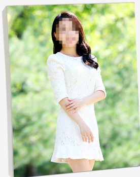
6R 야외이미지 아크릴액자(6 X 8 inch)