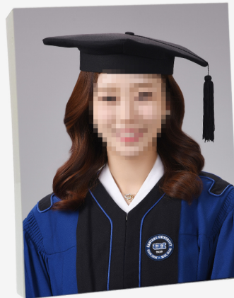
8R 학사복 아크릴액자(8 X 10 inch)